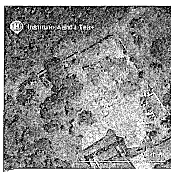
← area de transbordo